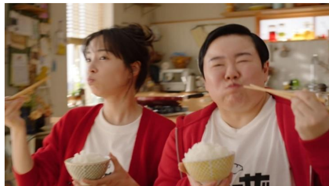
「ギョーザ」新 TVCM「羽根パネエ〜！篇」より

昨年5月に「冷凍餃子がフライパンに張りついてしまう」という1件のX(旧 Twitter)の投稿をきっかけに、SNSで「ギョーザ」が張りついてしまうフライパンの提供を呼びかけたところ、全国47都道府県より総計3,520個のフライパンが集まりました。当社は、一人でも多くの方に、キレイに焼ける「ギョーザ」をお届けするために「冷凍餃子フライパンチャレンジ」プロジェクトを立ち上げました。お送りいただいたフライパンを研究した結果、2024年2月に、調理時のフライパンからの剥離性を改善することで、より張りつきにくく、誰でもパリッとした羽根つきギョーザが焼けるようにリニューアルしました。ギョーザを食べる時だけでなく、ギョーザを焼く時も最高に楽しくなり、キレイな羽根つきギョーザが焼きあがった時の「感動」をさらに実感いただけるようになりました。