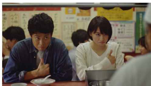
「ザ★ ® チャーハン」TVCM 妹登場篇より