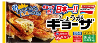
&lt;しょうがギョーザ&gt;