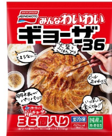
「みんなわいわいギョーザ」（新製品）