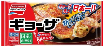
「ギョーザ」（リニューアル品）

味の素冷凍食品株式会社（社長：吉峯英虎 本社：東京都中央区）は、売上日本一の「ギョーザ」をリニューアルするとともに、いつも食べたくなる餃子の新定番に「しょうがギョーザ」を、ファミリー向けの大容量パック「みんなわいわいギョーザ」を2018年8月12日（日）より全国で発売します。