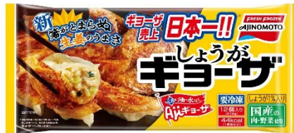
「しょうがギョーザ」（新製品）