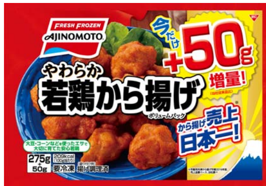
「やわらか若鶏から揚げ ポリュームパック」