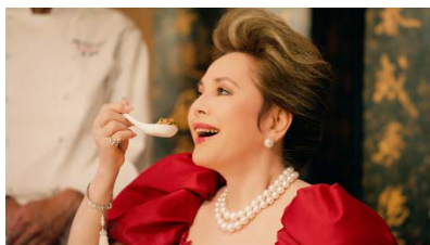
オイスターソースに