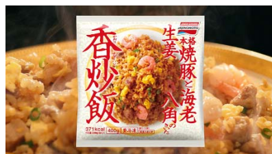
香りと具材を頬張る