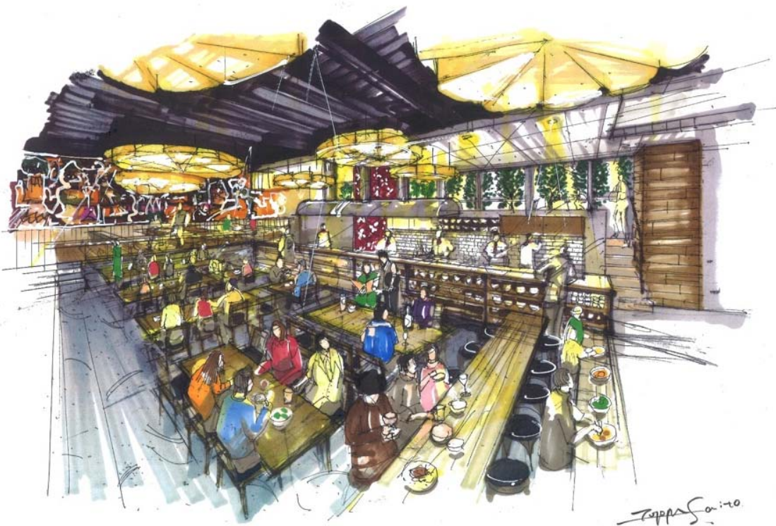
【「GYOZA I T.」 店内イメージ】

さらに、「日本式餃子」を大量に焼き上げる5mの鉄板が見えるオープンキッチンで、食欲をそそる香り、焼ける音、見事な焼き目、パリッとした食感、おいしさにいたるまで、「日本式餃子」を五感で存分にお楽しみいただけます。