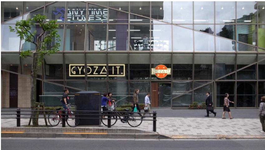
【「GYOZA IT.」 外観イメージ】

味の素冷凍食品株式会社（社長：吉峯英虎 本社：東京都中央区）は、「GYOZA」の魅力の世界に発信することを目的に、「日本式餃子」をワインやシャンパン等とおしゃれに気軽に楽しんでいただけるレストラン「GYOZA IT.」を、2017年9月7日（木）より東京都港区赤坂にオープンします。