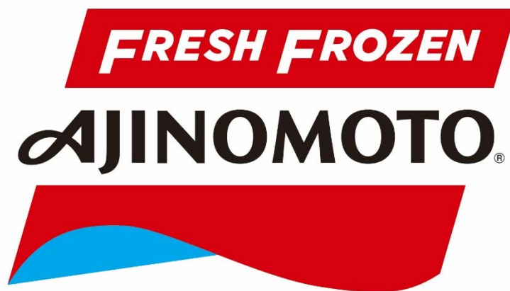
【新ブランドロゴマーク】

味の素冷凍食品株式会社（社長：吉峯英虎 本社：東京都中央区）は、このたび、ブランドロゴマークを刷新し、2017年7月6日（木）より順次切り替えます。