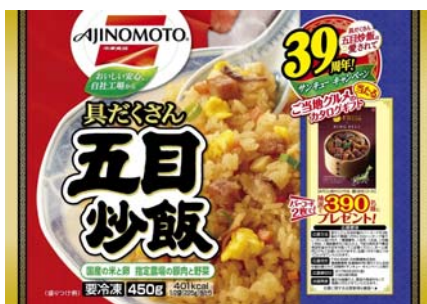
キャンペーンパッケージ品